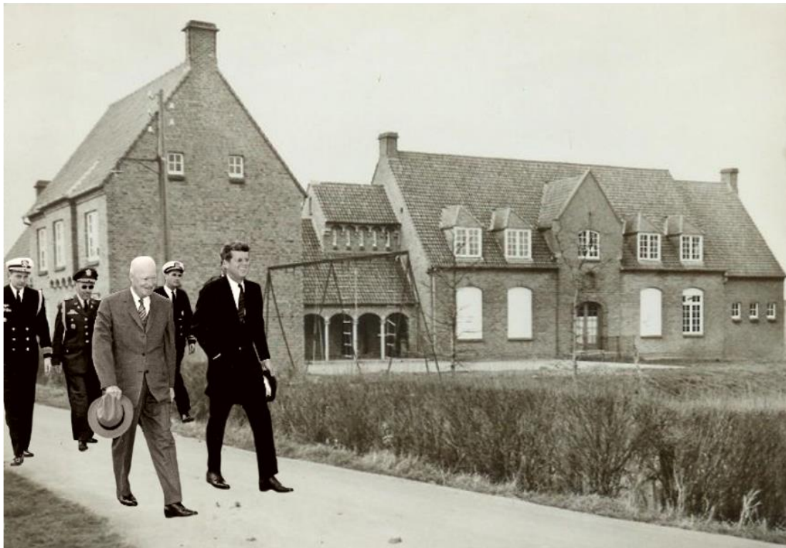
President Kennedy & oud-president Eisenhower bij Monsalvaet (1961)

Waarom Westouter? Wel, zoals je misschien wel of niet weet is de Amerikaanse ambassade daar gevestigd. De Amerikanen kozen precies net deze plaats uit vanwege zijn strategische (middenin het Vlaams heuvelland) maar toch verborgen ligging.